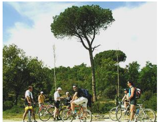
Talfahrten, hügelig, mit sanften Steigungen, wie sie für die Bahn möglich waren.

Rücktransfer von der Costa Brava nach Beget zum Preis von Fr. 30.-- pro Person (inkl. Rad) möglich, Reservierung erforderlich, begrenzte Platzzahl, zahlbar vor Ort.